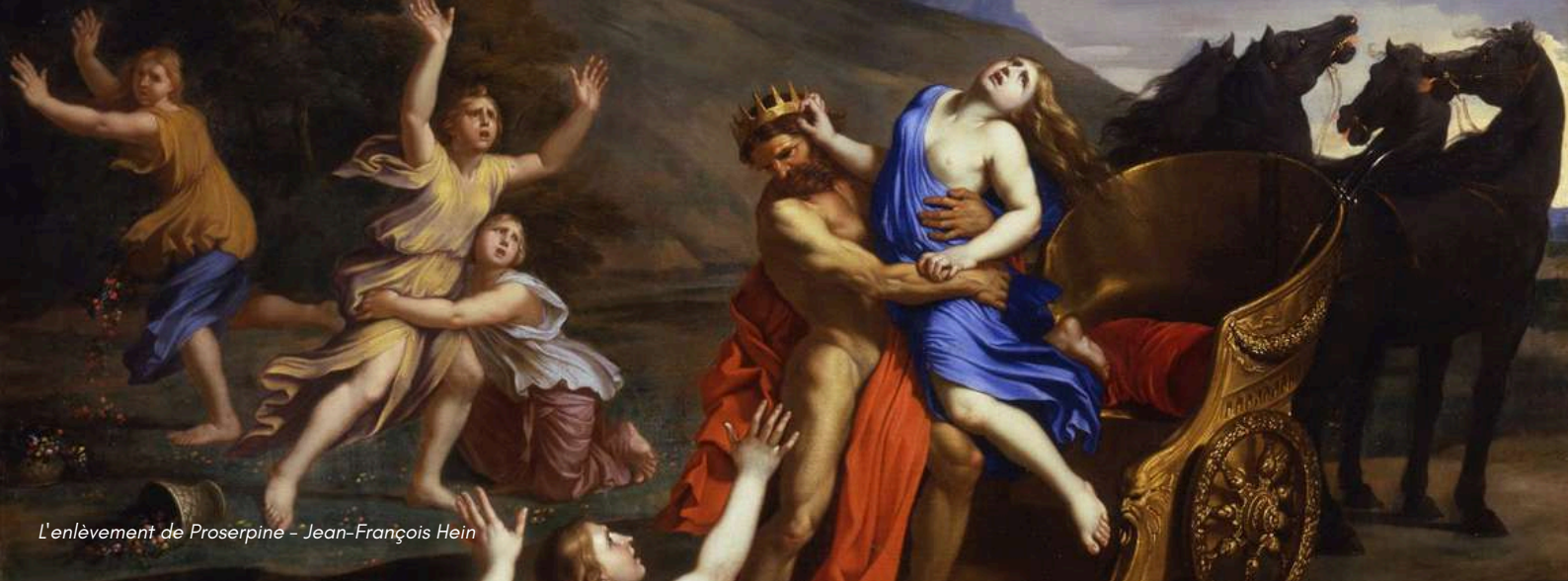
L'enlèvement de Proserpine - Jean-François Heintz