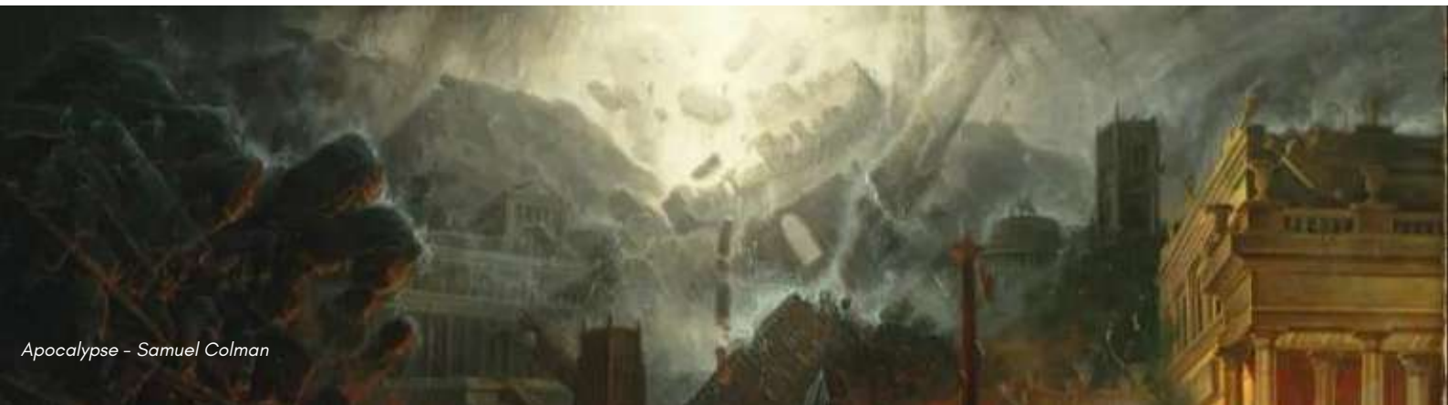
Apocalypse - Samuel Colman

Ces petites formes, qui durent entre 10 et 15 minutes chacune (1h15 en tout), offrent une vision ludique et originale des mythes grecs, tout en les ancrant dans la culture populaire, la musique contemporaine et une théâtralité de tréteaux, grâce à laquelle les comédien.ne.s changent de personnages et de formes au fil de l'histoire, qui se tisse en direct, devant le public. Le spectacle se joue aussi bien dans un théâtre, qu'en salle de classe ou en extérieur.