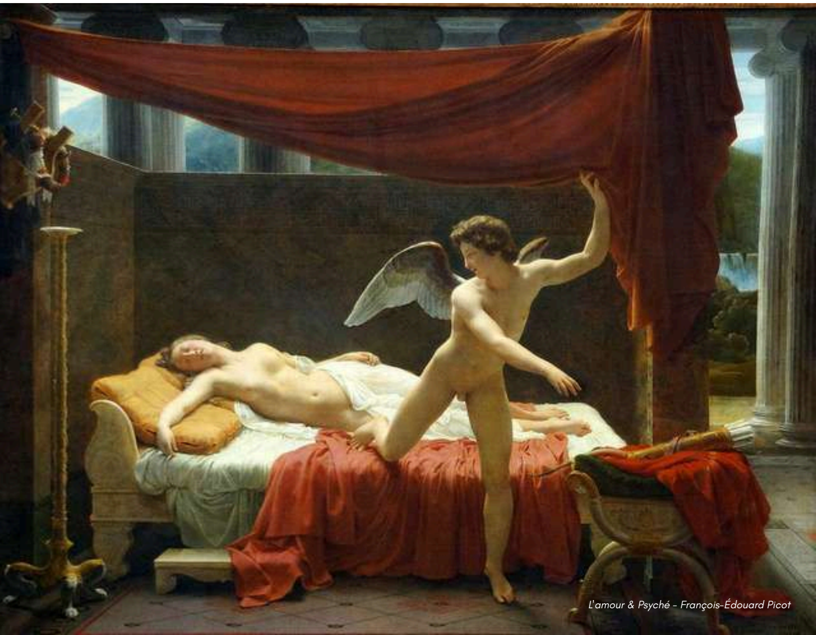
L'amour & Psyché - François-Édouard Picot