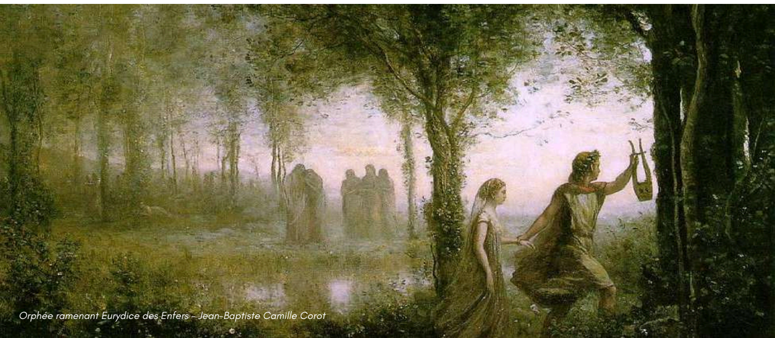
Orphée ramenant Eurydice des Enfers - Jean-Baptiste Camille Corot