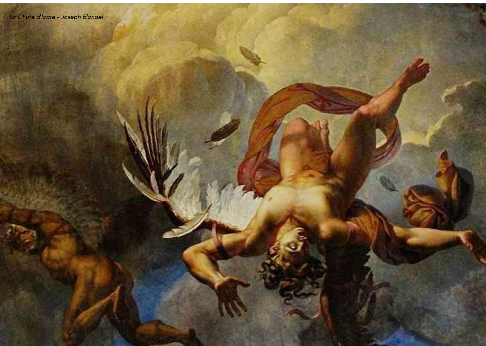
La Chute d'Icare - Joseph Blondel

Aucune lumière n'est nécessaire, les capsules peuvent se jouer aussi bien dans un théâtre que dans une salle de classe, une médiathèque ou en extérieur. L'idée est que le dispositif puisse s'adapter à chaque lieu d'accueil et en tire le meilleur pour raconter au mieux ces histoires et emporter le public dans son imaginaire.